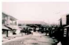
昭和初期の湯田温泉駅の風景