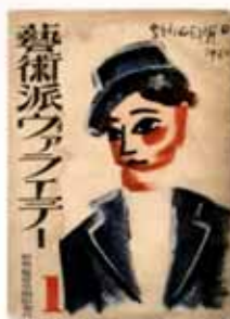
「姉の手紙」が掲載されていた雑誌「藝術派ウオメン」