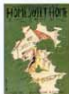
昭和初期のハーモニカ楽譜 「HOME SWEET HOME」