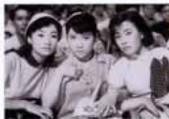
「ひばり・チエミ・いづみのジャンケン娘」