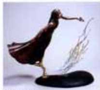
「AQUA IV」 90×40×73 銅、真鍮、鉄、チタン